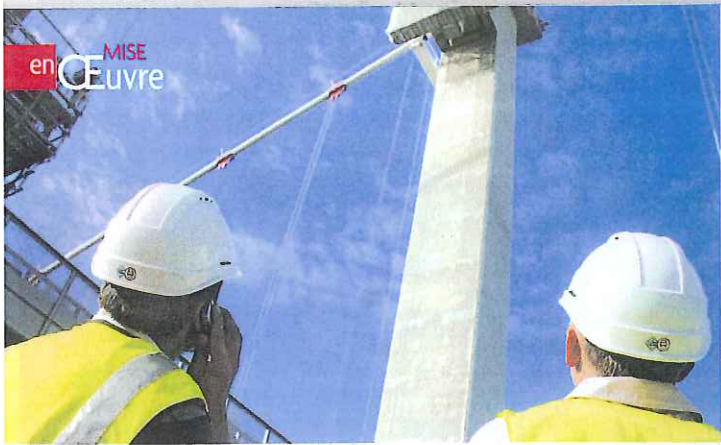
En fonction de l'importance des surfaces dégradées, trois types de mortiers de réparation Parexlanko sont utilisés sur le chantier.