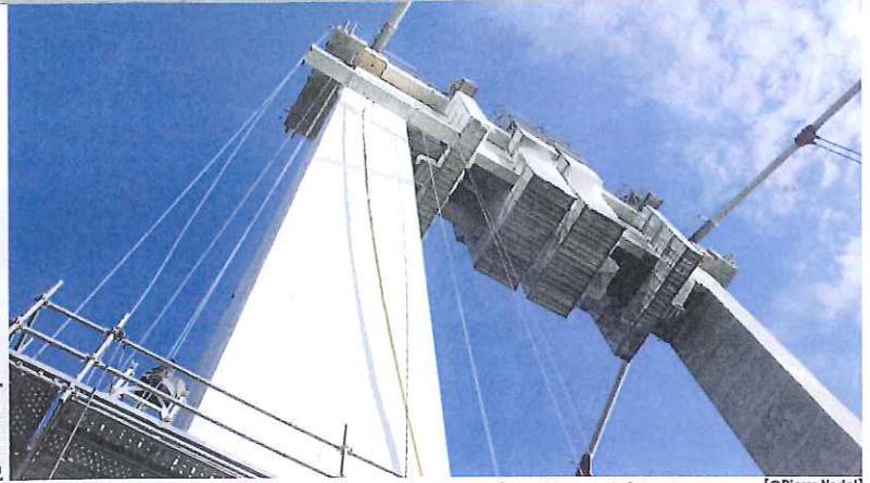
Mise en œuvre des trois couches de protection du système Chryso Résipoly.